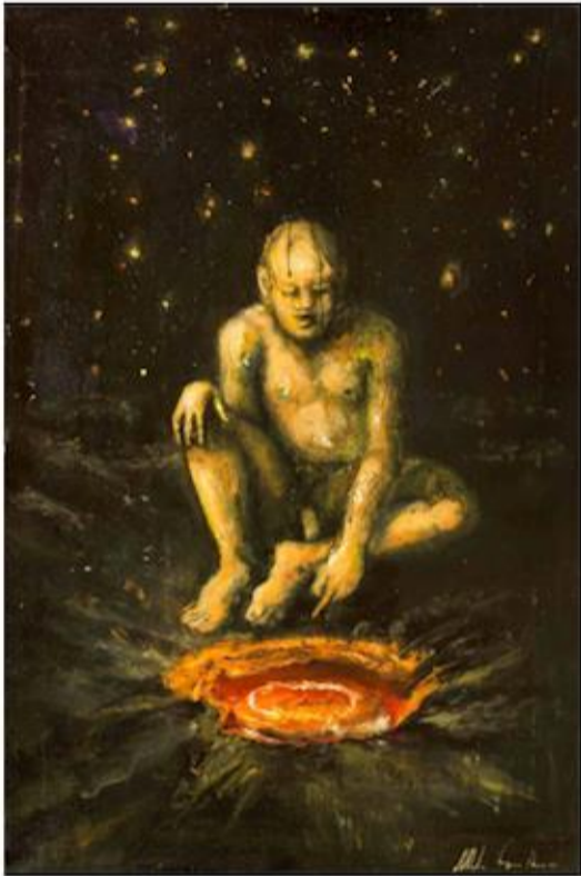
Fuego interno, Óleo sobre tela, 100 x 80 cm, 2016.

Sus directivos le explicaron que en tanto gestionan los recursos del gobierno estatal, un donativo permitirá abonar el adeudo a trabajadores, desde mayo de 2020.