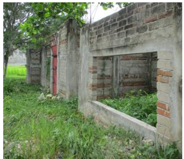
FOTO – 4.- Condición de la construcción y la construcción vista desde el interior del terreno

Mi celular – 954 126 50 11. Trato directo con Genaro Aragón Reyes.