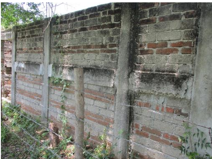
Imagen - 3.- Esquina del lado poniente del terreno, sobre Av. México, la toma de luz.

Gráfica - 2ª En el interior del terreno en la esquina que hace la parte sur y poniente, se encuentra el pozo de agua, (POZO NORIA).