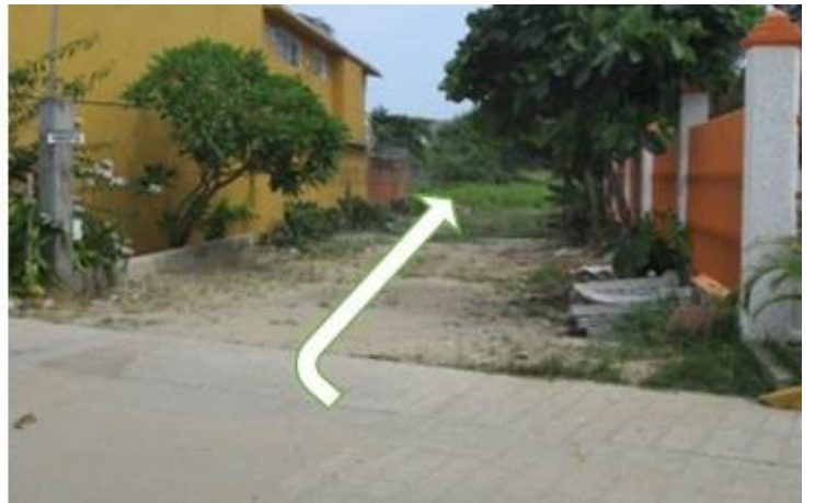
FOTO – 1.- ESTA ES LA CALLE QUE BAJA CON DIRECCIÓN A LA PLAYA – PARTIENDO DE LA AV. ALEJANDRO CÁRDENAS PERALTA, CALLE PARALELA A LA AV. MÉXICO, (ANTES CALLE CALIFORNIA). GRÁFICA – 2.- Calle Chiapas, al fondo hace esquina con la Av. México, donde se encuentra el terreno en mención.