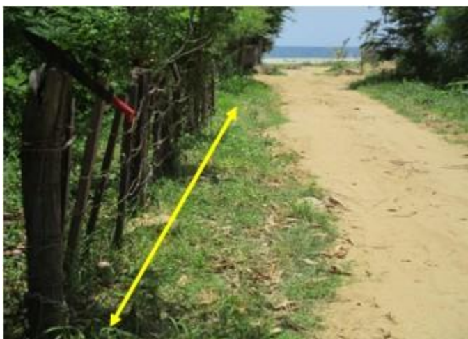
Lado norte mide – 12.60 Mts.