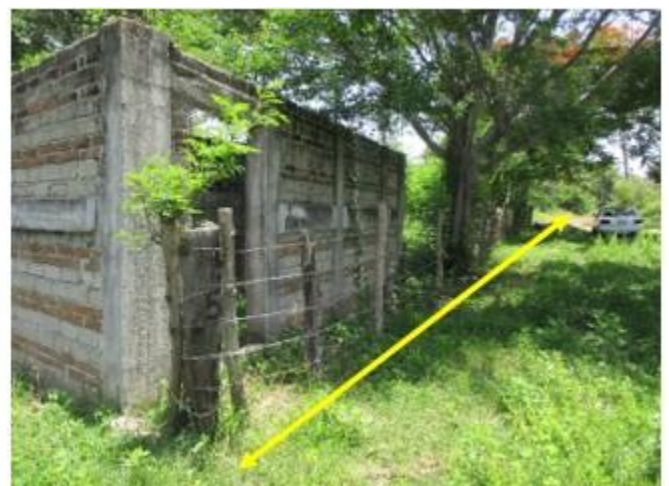
Lado oriente mide – 32.50 Mts.