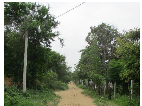
Foto - 1ª. Se puede apreciar la esquina de la Av. México con la calle Nogales, en este lugar a 40 metros del terreno está la toma de agua potable.

Gráfica - 2ª En el interior del terreno en la esquina que hace la parte sur y poniente, se encuentra el pozo de agua, (POZO NORIA).