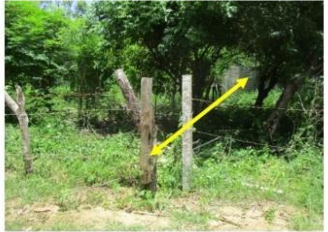
Lado poniente mide – 30.50 Mts.