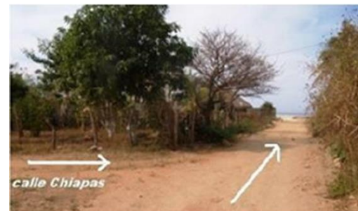
Foto – 1.- La calle Tamaulipas hace esquina con la calle Chiapas, ahí se ubica el Hotel Xima-Xo. Imagen – 2.- Circular con dirección de sur a norte hasta llegar a la esquina. Gráfica – 3.- Se aprecia el terreno en la esquina de la calle Chiapas que topa con la Av. México, (ANTES CALLE CALIFORNIA).