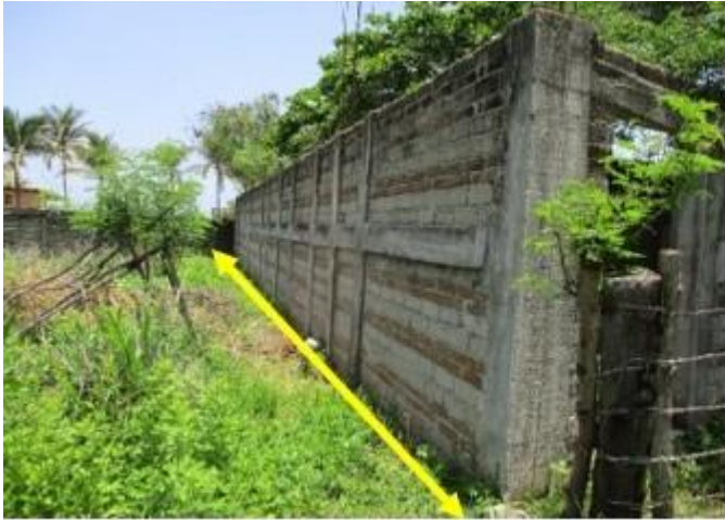
Lado sur mide – 23.90 Mts.