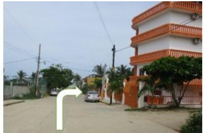
IMAGEN – 3.- En la Colonia Brisas de Zicatela, Colotepec, el terreno está ubicado a la mitad de lo que es la PLAYA ZICATELA, cuenta con los servicios de luz, agua potable, pozo noria con suficiente agua y telefonía PLAYA ZICATELA se considera del morro, (frente al hotel Santa Fe), a punta Zicatela, SON 3 KILÓMETROS, a partir de la colonia Marinero, es considerada la zona residencial, turística y comercial de más plusvalía en Pto. Escondido, Oax. Los hoteles y residencias son el atractivo del turismo nacional e internacional